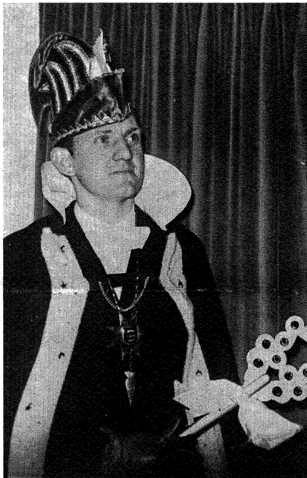
PRINS CORI (1966)

Losse groepe wère verzòchtj bije de wages van heur eige buurt te blieve en estebleef bije den troep blieve tot det de optocht is aafgelaue. De pelisie zal ei eugske in het zeil hõje.